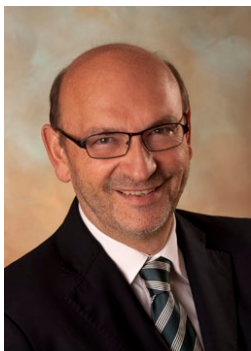
Mag. Johann Heuras (Amtsführender Präsident des LSRfNÖ)

Im Zuge der Neugestaltung der PH-NÖ-Website www.ph-noe.ac.at haben wir ergänzend zu den Bildungskatalogen neue Informationsmöglichkeiten zum Fort- und Weiterbildungsprogramm geschaffen. Diese finden Sie beim Aufruf der zugehörigen Menüpunkte auf der Startseite.